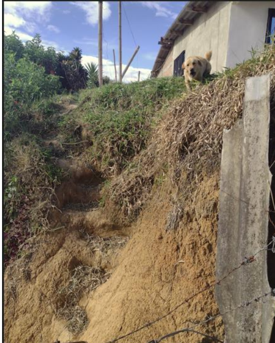
Imagen 4-mes julio-2024