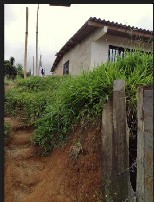
Imagen 1-mes de abril-2024