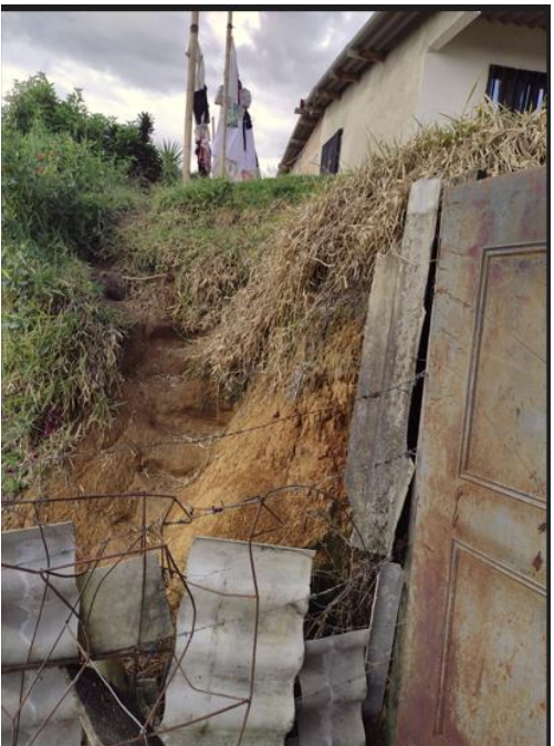
Imagen 3- mes junio-2024