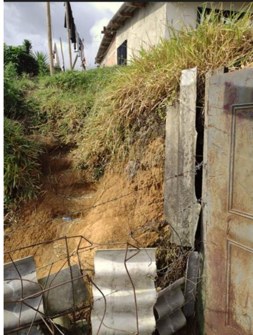
Imagen 2-mes de mayo-2024